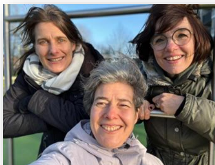
Het "Begaafd Dordt" team

Ben je nog geen talentbegeleider, maar ambieer je dat wel dan is het zeker mogelijk om hierbij aan te sluiten.